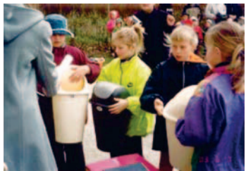
Jäätmete sorteerimine ühes Eesti lasteaias

REC Estonia on üks kuuest kümnest RECi kohalikust esindusest, kes on ellu viinud mitmeid säästva arengu projekte. Selle projekti raames on REC Estonia eriti huvitatud teiste kogemustest transpordi vallas – autode hulga kasv Eestis on üks Kesk- ja Ida-Euroopa kiiremaid.